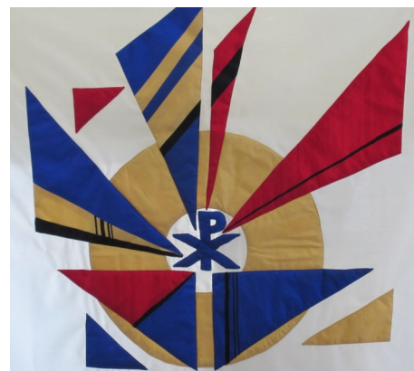
Innenansicht des Tammer Fronleich- namshimmels

Da wir ja seit April in unserer Seelsorgeeinheit keinen eigenen Pfarrer mehr haben, ist es leider nicht möglich, an Fronleichnam drei Eucharistiefeiern anzubieten. Daher werden wir in diesem Jahr das Fronleichnamsfest als gemeinsamen Gottesdienst der Seelsorgeeinheit in Tamm feiern. Bei gutem Wetter beginnt der Gottesdienst um 10 Uhr auf dem Kelterplatz. Danach ziehen wir mit der Prozession zur St.-Petrus-Kirche. Im Anschluss an den Gottesdienst ist die Gemeinde noch herzlich zum Fröhschoppen mit Weißwurstfrühstück eingeladen. Bei schlechtem Wetter beginnen wir in der Kirche.