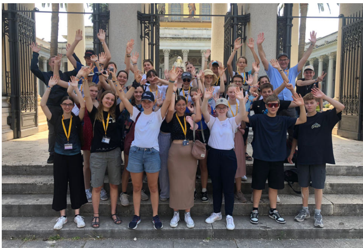
Die Minis unserer Seelsorgeeinheit vor der Kirche San Paolo Fuori Le Mura