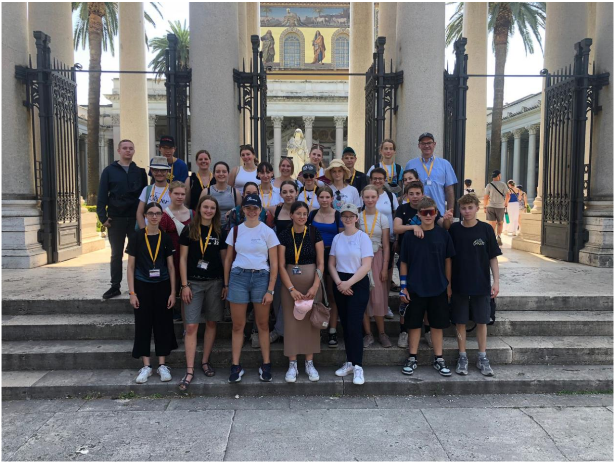
Gruppenbild vor St. Paul vor den Mauern