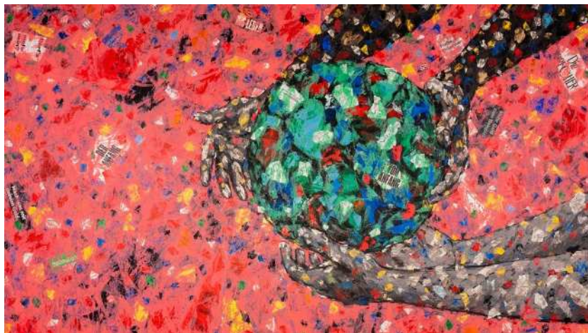
Was ist und heilig? Das Misereor-Hungertuch 2023

en und nutzt die Überschneidung von Bildern und Strukturen als Mittel. Er versucht damit einen tieferen Einblick in die Art und Weise zu gewinnen, wie wir miteinander kommuni-